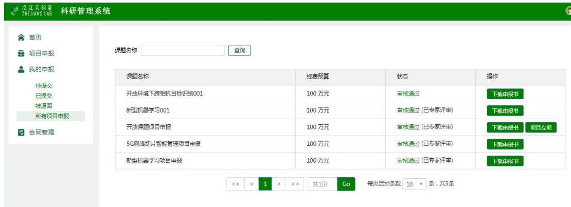
图 12 查看各状态下的我的申报

提交完成后等待科研发展部形式审查。展开页面左侧【我的申报】，可查看我的各种状态的项目申报，如下图所示。