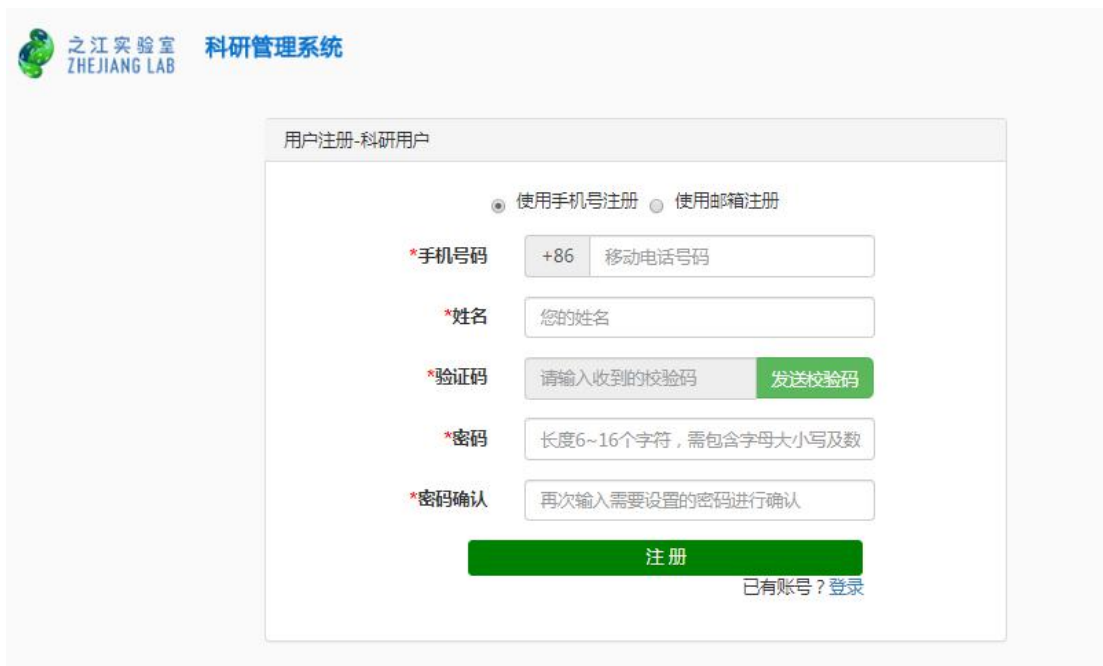
图 2 申报人员注册页