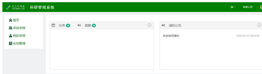
图 4 系统主页