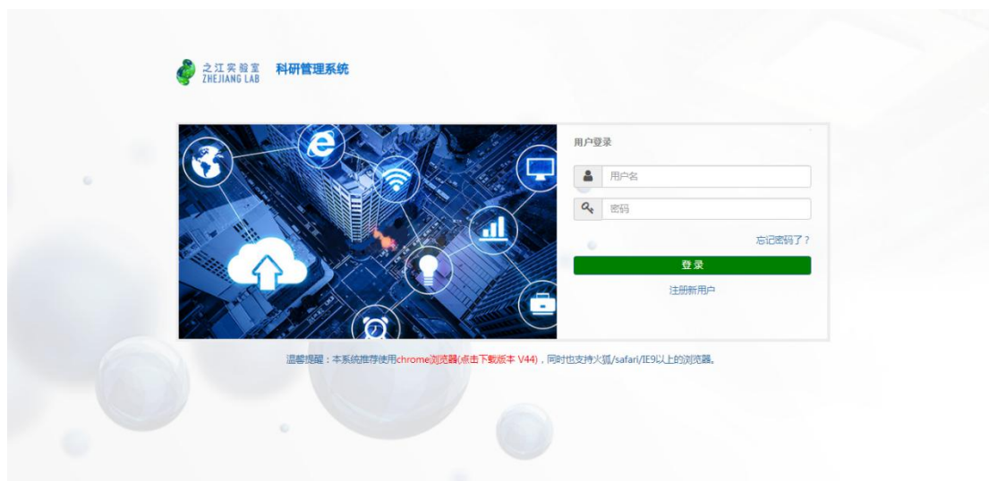
图 1 系统登录页

有账号的用户直接输入用户名及密码登录系统，没有账号的用户点击【登录】按钮下方的“注册新用户”，进入注册页面，如下图。